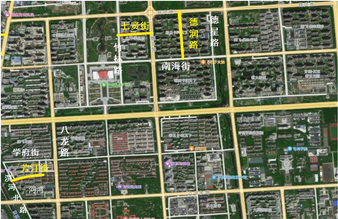
图 6 景瑞街